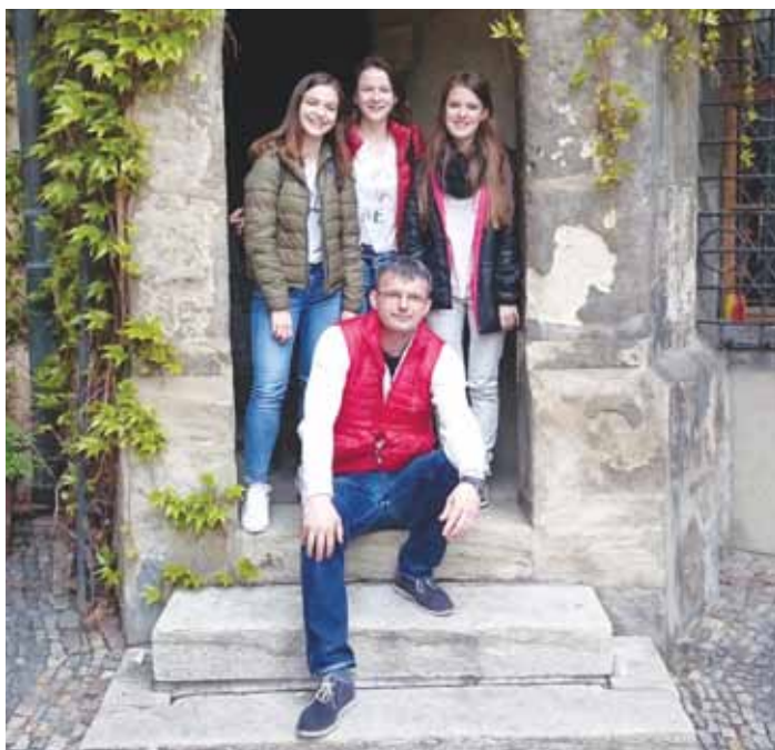
S DĚJEPISNÝM KROUŽKEM po stopách gotiky v Kutné Hoře.

„Dětem je dána zdravá soutěživost a dějepis není výjimkou. Často mne něco napadne a žákům stačí ten prvotní impuls pro rozvinutí dalších nápadů. Před lety jsem například přišel s myšlenkou zopakovat a shrnout v šestém ročníku učivo o antickém Řecku formou soutěže v dobových kostýmech, kde by se představily různé osobnosti řecké kultury a zároveň by žáci byli prověřeni ze znalostí o tomto období. Mile mne překvapil jejich zájem o celou akci a žáci sami její průběh doplňovali svými nápady. Nakonec se z toho stal projekt, který je každoroční tradiční záležitostí. Spolupracuji na něm