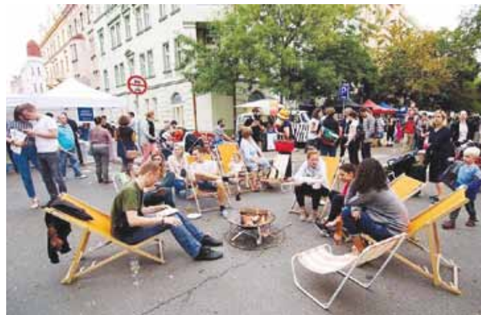
ZAŽÍT MĚSTO jinak v Karlíně.

poznávání včelařství nebo kompostování, u dýní a bylinek nebo mezi poklady na blešáku. Restauratéri se pochlubí svými majstrštyky a obchodníci svými výrobky, děti budou vyrábět ze dřeva, opékat buřty nebo