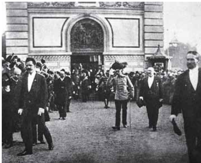
CÍSAŘ FRANTIŠEK JOSEF I. na Jubilejní výstavě v Praze roce 1891.

Po dohodě obecní rady s nejvyššími místy vlak při průjezdu