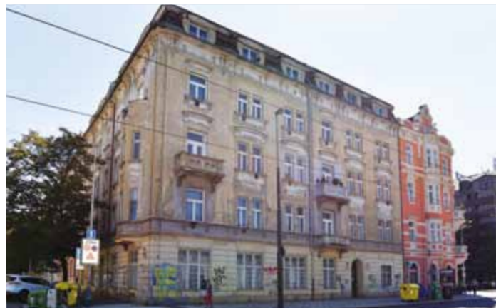
DŮM, JEHOŽ IDEÁLNÍ polovinu chce radnice odprodat spoluvlastníkovi.