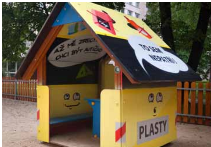
HERNÍ PRVKY na některých dětských hřištích dostaly novou „fasádu“.

Nemějte obavy, že by mohl být váš oděv zamáznán od barvy. Lepkáva je pouze antigraffiti úprava celého povrchu. Bezpečnostní list nátěrových barev je podle 1907/2006/ES, Článek 31, datum vydání: 16. 12. 2015, revize: 16. 12. 2015. Jedná se o nezávadný materiál, který není zdraví a životnímu prostředí škodlivý. (eš)