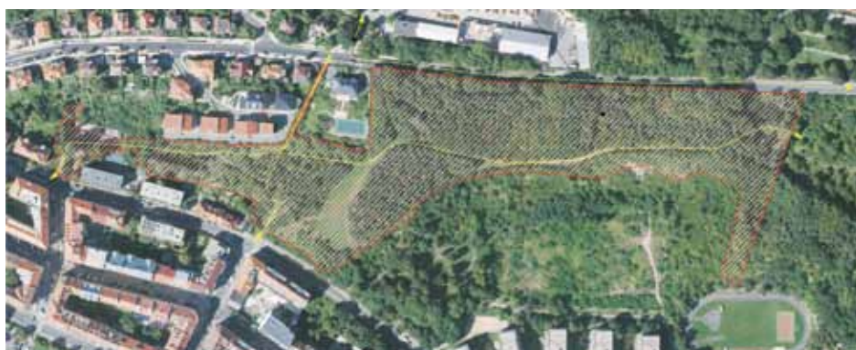
ZÁPADNÍ ČÁST LOKALITY Prosecké skály z ptáčích perspektivy.

Západní část lokality se nachází ve vlastnictví hl. m. Prahy, východní část je v majetku řady soukromých vlastníků. Na obrázku je vyobrazeno schéma právě západní části lokality, pro které byla vytvoře-