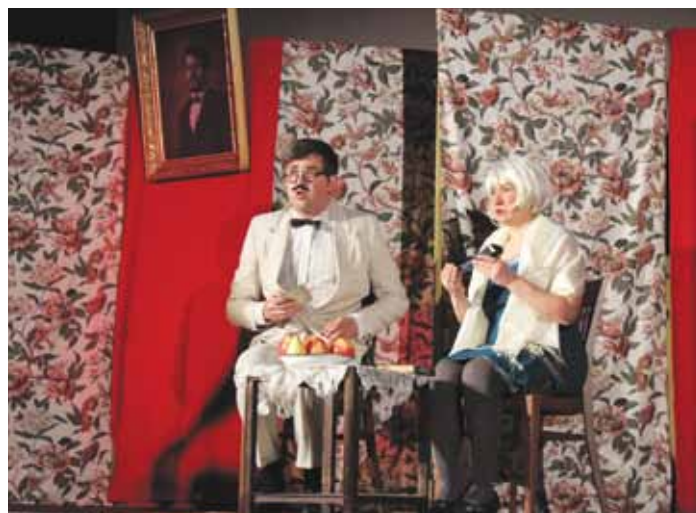
SOUČASNOST ČESKÉ OCHOTNICKÉ divadelní scény představuje například soubor KIX z Buštěhradu.

V roce 1950 byly všechny spolky rozpuštěny s tím, že každý soubor má mít svého zřizovatele, nejlépe ROH, ČSM či JZD. Byl sestaven seznam divadelních her pro ochotnická i profesionální divadla tak, aby odpovídal socialistickému duchu doby, nechyběla v něm však i česká klasika. Ochotnické divadlo postupně ztrácelo svůj význam a bylo hodnoceno ne z hlediska odborného, ale