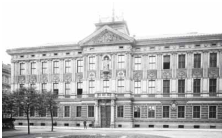
BUDOVA TEHDEJŠÍ KARLÍNSKÉ RADNICE, kterou císař navštívil během svého pražského pobytu.