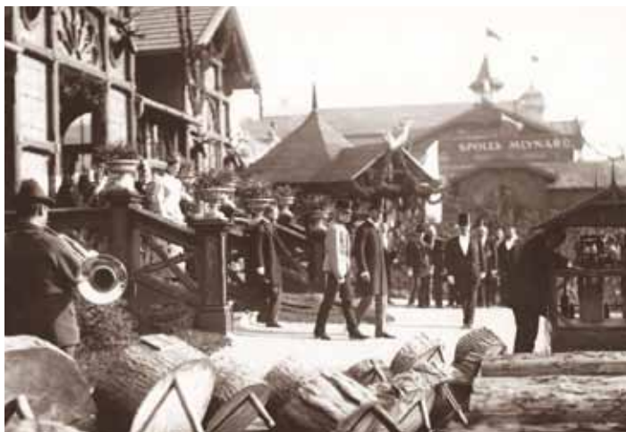
CÍSAŘ NA PROHLÍDKU šlechtických pavilonů na Jubilejní výstavě.