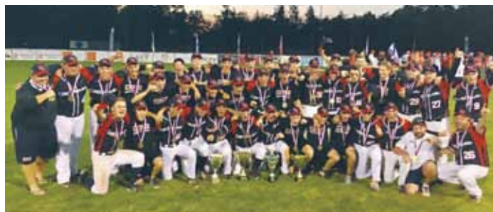
MLADÍ ČEŠTÍ SOFTBALISTÉ s poháry mistrů Evropy.

Do pražských Bohnic přijely reprezentace Dánska, Izraele,