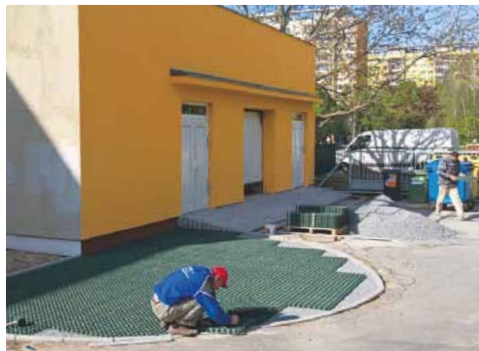
BÝVALÁ TRAFOSTANICE u ZŠ Žernosecká před zahájením prací a těsně před dokončením úprav, které objekt mění na odbornou dílnu pro školní výuku.