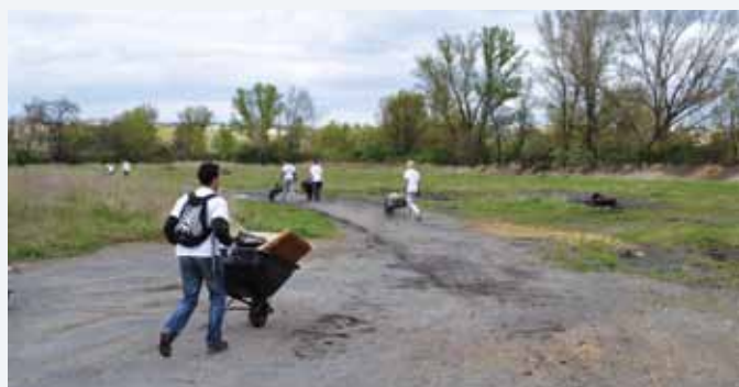
PŘI ÚKLIDU Rohanského ostrova přišla ke slovu i klasická kolečka.

Spolek Komunita Rohan neorganizuje jen úklidy Rohanského ostrova, ale usiluje také o to, aby došlo ke kultivaci celého tohoto území. Cílem je vytvoření přívětivé oblasti, kterou by veřejnost mohla využívat po celý rok pro své volnočasové aktivity. Rohanský ostrov by se tak přeměnil na atraktivní veřejný prostor, který by byl aktivně navštěvován nejenom občany MČ Prahy 8, ale i obyvateli okolních městských částí. (pep)