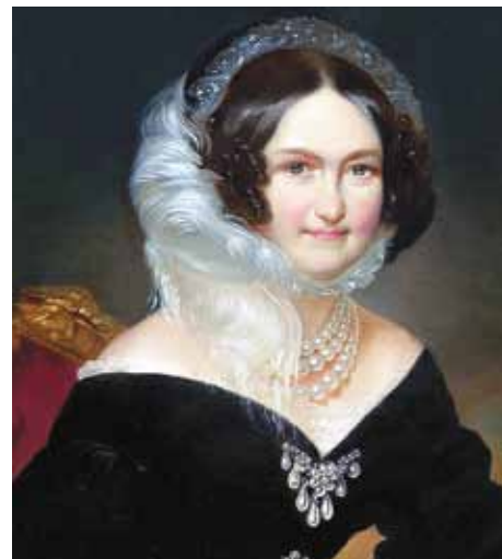
KAROLÍNA AUGUSTA BAVORSKÁ – čtvrtá manželka císaře Františka I.

Plán 8. května 1817 schválila dvorská kancelář ve Vídni a hned 23. června císař František I. potvrdil i založení prvního pražského předměstí nazvaného na počest jeho choti, císařovny rakouské, královny české, uherské a chorvatské, Karoliny Augusty Bavorské: Karolinenthal. Jako české varianty názvu se střídaly Karolínino údolí, Karolínčany, Karolínov, Karlínov,