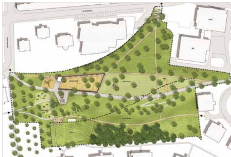
ÚZEMÍ parku Dlážděnka.

Městská část Praha 8 zorganizovala architektonickou soutěž Revitalizace parku Dlážděnka s cílem upravit parkové plochy a přilehlé okolí tak, aby lépe odpovídaly současným potřebám a požadavkům zejména obyvatel nejbližšího okolí. Dlážděnka by se měla stát zajímavým a vyhledávaným místem klidu a odpočinku i v širším kontextu Prahy 8 – její poloha na exponované terénní hraně ji k tomu přímo předurčuje. Park je důležitým bodem na zelené rekreační ose, vedené na hraně a po úbočí vltavských svahů. Obnovení, zprostřednění a také vyznačení této osy