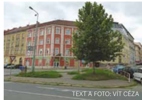
TEXT A FOTO: VÍT CÉZA

Zachováme zde stávající strom, přidáme odpadkový koš a necháme odplevelit existující zpevněné plochy vedoucí mezi jednotlivými trávníky. Zároveň zřídíme dva nové květinové záhony. Na přání občanů nebudou přidány lavičky a nedojde ani k žádnému odstranění zelených ploch či jakékoli změně místa například na parkoviště, kterého se občané v dotaznicích obávali.