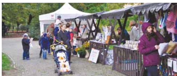
FAIRTRADOVÉ produkty byly ke koupi na trhu Férový Karlín.

JANA MARTÍNKOVÁ ODDĚLENÍ STRATEGICKÉHO ROZVOJE A MA1