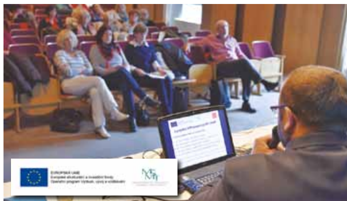
SETKÁNÍ ŘEDITELŮ škol Prahy 8 při spuštění MAP v KD Krakov.

„Počítáme s rozpočtem téměř tři miliony korun, na který se nám podařilo získat bezmála stoprocentní dotaci od ministerstva školství. Doufám, že se nám bude dařit i v budoucnu čerpat finance z evropských fondů,“ uvedla radní Anna Kroutil.