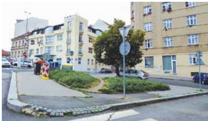
PLOCHA NA KŘÍŽOVATCE ulic Primátorská Konšelská.

životní prostředí a byla jí vyjádřena jednoznačná podpora. Následně došlo k výběru konkrétních vhodných ploch, které se nacházejí na frekventovaných místech a zároveň jejich vlastnická práva samotnou revitalizaci umožňují. Vybrány byly celkem 3 lokality: veřejná plocha na křižovatce ulic Zenklova, Podlipného a Braunerova, dále plocha na křižovatce ulic Primátorská a Konšelská a také plocha na křižovatce ulic Zenklova a Prosecká. Předseda