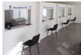
REGISTRAČNÍ MÍSTO v Karlíně.

registraci předložit velký technický průkaz vozidla a občanský průkaz. Roční parkovací oprávnění pro jednu ze tří parkovacích oblastí na Praze 8 stojí občany mající v ní trvalé bydliště 600 Kč. Lidé starší 65 let mají cenu snižovanou na 180 Kč. Oprávnění pro všechny tři parkovací oblasti v Praze 8 vyjde na 1 200 Kč, lidé nad 65 let zaplatí 360 Kč. Na všech pobočkách je možné