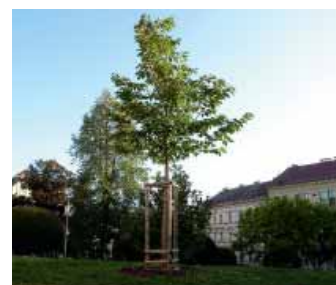
► Aby bylo i v budoucnu co slavit – výsadba stromů v Praze 8.

V rámci třetího svátku budeme oslavovat Den osmičkových parků, který se inspiruje Evropským dnem parků, jenž se koná z podnětu Federace evropských parků. Den osmičkových parků se však bude věnovat výhradně Praze 8 a z toho důvodu bude slaven v ji-