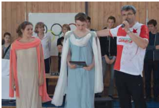
► Zahájení Olympiády, kterou pořádá žákovský parlament na Na Slovance.

Žákovský parlament organizuje každým rokem mnoho oblíbených akcí, a tak na prvních schůzkách rozhoduje, jaké akce budeme daný školní rok organizovat nebo se na nich alespoň podílet. Již tradiční akcí je SlovankaFest. Akce, na které můžete vidět různorodá vystou-