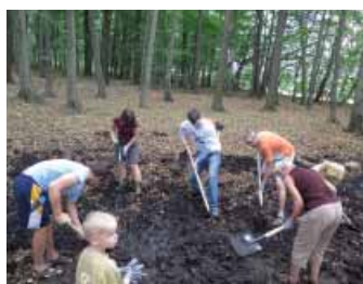
► Revitalizace jezírka v Čimickém háji.

Vzhledem k současným globálním změnám klimatu a na mnoha místech negativnímu stavu naší krajiny se bude třeba mnohem více věnovat krajinotvorným opatřením a nápravám současného stavu. K zásadním aspektům, kterým se bude nutně v rámci zlepšování stavu krajiny věnovat, patří koloběh vody. Vedení Prahy 8 proto otevírá diskuzi o problematice vod, jejímž cílem bude vytvořit soubor budoucích opatření, která přispějí ke zlepšení vodstva v Praze 8.