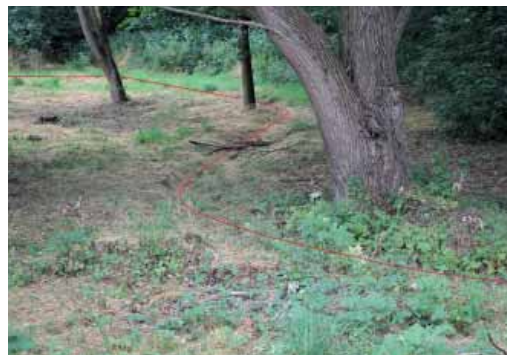
► Čimický potok s vyznačeným původním korytem. Cílem je návrat potoka ze země do tohoto koryta.

Praha 8 má malý počet rybníků, jezírek či na povrchu tekoucích drobných vodních toků. Některé vodní toky jsou trvale zatrubněné, zbytečně zpevněné či netečou ve svém původním korytu. Komise pro životní prostředí proto zahajuje sběr potřebných dat a začíná oslovovat jednotlivé zúčastněné subjekty s cílem připravit podklady pro budoucí realizace. Přestože je za oblast ochrany vod odpovědný Magistrát hl. m. Prahy, před Prahou 8 stojí mnoho významných úkolů. Předně chce dozorovat a komunikovat jednotlivé úpravy a revitalizace vodních toků a nádrží, ale také koncepčně rozhodovat o budoucích nových opatřeních, jako je výstavba či odpovědná úprava rybníků, jezírek a vodních prvků, která naší městské části umožní se lépe adaptovat na probíhající změny krajiny. V současné době se již uskutečňují (nebo se uskutečnily)