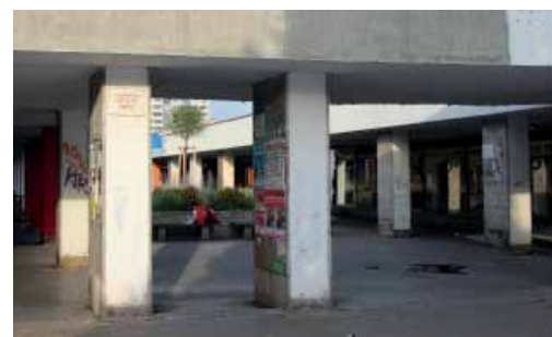
► Na těchto sloupech plánuje městská část vystavit studentské návrhy revitalizace náměstí Ládvi.

Přijďte v sobotu 19. září zažít Ládvi jinak! ◀ (vic)