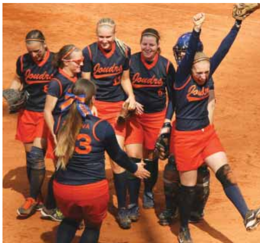
▶ Radost softbalistek Joudrs Praha z postupu do finále evropského poháru.

Hlavní vrchol roku mají bohnické softbalistky za sebou, ale sezóna jim zdaleka nekončí. Rády by vybojovaly domácí mistrovský titul i prvenství v českém poháru, a zajistily si tak účast v evropských pohárech i pro příští rok. ◀ (vrs, pp)