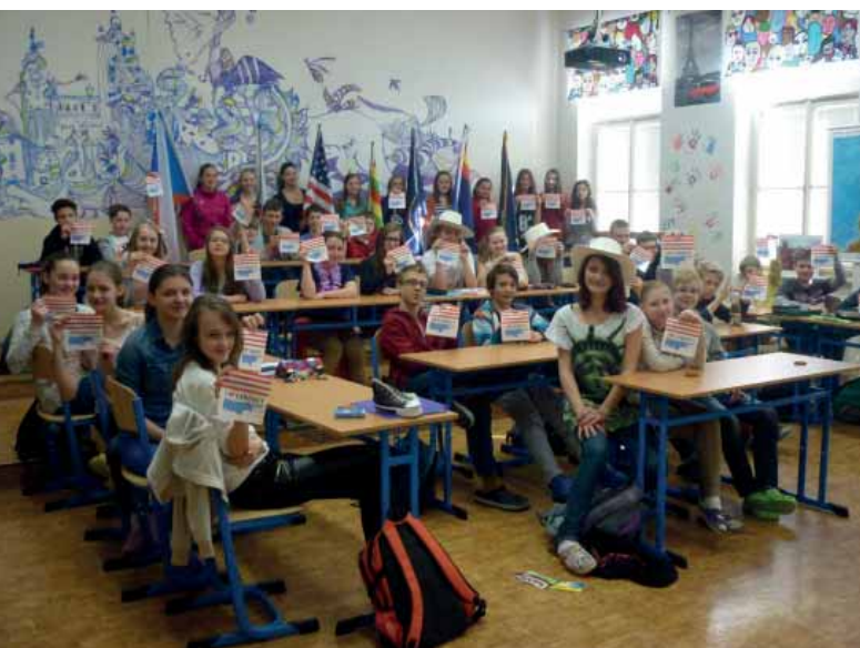
▶ Cestopisná přednáška o USA v mediální učebně.