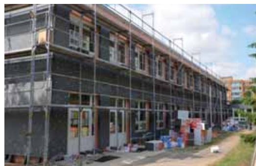
► Zateplování Mateřské školy Krynická.