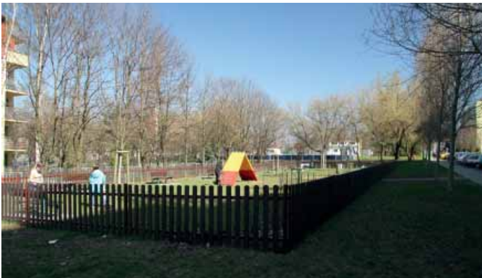
► Psí louka u ulice Katovická.