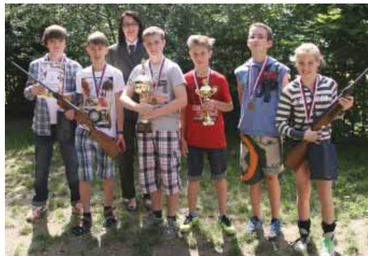
► Vítězný celek mladých střelců ZŠ Žernosecké.

Z dvanácti zúčastněných škol postoupily do finále ZŠ Žernosecká, ZŠ Lyčkovo náměstí a ZŠ Mazurská. Finále, které se konalo 4. června v areálu družiny ZŠ U Školské zahrady, pak proběhlo jako vždy v mysliveckém duchu – celé je provázel trubač, děti se mohly seznámit s loveckými psy, pernatými dravci