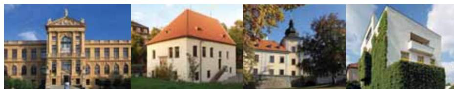
MUZEUM HLAVNÍHO MĚSTA PRAHY – ČERVENEC 2015