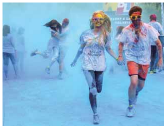
► Hlavně v té barevné mlze neztratit jeden druhého!