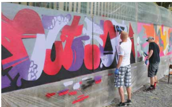
► Jednou ze zajímavých akcí Salesiánů byla legální „výroba“ graffiti

Tradiční kino nabízející atraktivní novinky a kvalitní filmovou produkci pro každou generaci