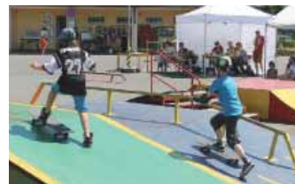
► Závodů na skateboardech

Oproti předchozím letním prázdninám, kdy byla služba v Nízkoprahovém klubu omezena, nyní nově reagujeme na potřeby dětí a mladých. V terénní formě jsme upravili a zpravidelnili trasy a tím zefektivnili službu. Terénní forma bude probíhat celé léto beze změn (po–čt 15:00–19:00) a klub Vrtule bude otevřen v červenci po–čt 15:00–19:00. V srpnu klub otevřeme jen na první týden, jelikož v dalších týdnech budou prostory využity pro příměstské tábory. Na léto plánujeme spolu s dětmi a mládeží